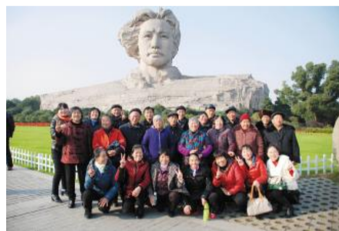
游览完橘子洲头后大家在毛主席青年头像前合影