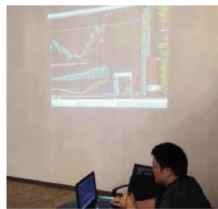
华林证券讲师在讲解