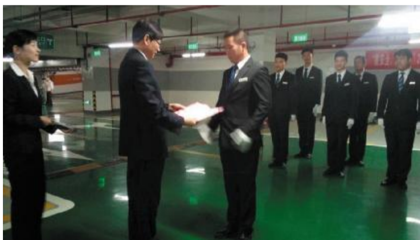
酒店车管部技能比武现场