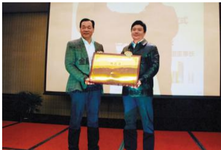
雨花区委书记邱继兴为顺天IFC授牌