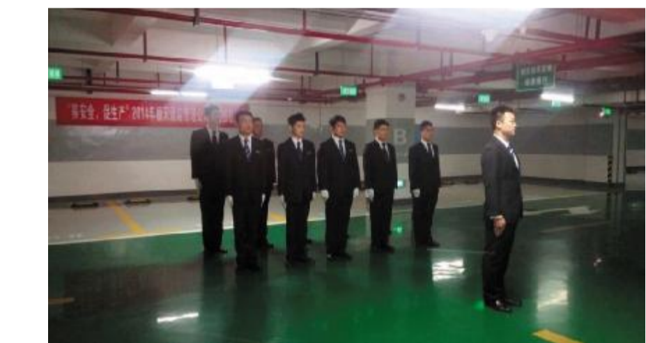
酒店车管部技能比武现场

此次技能比武分为两部分，第一部分为团队汇报演出，所有参赛队员集体展示，就近期的训练情况及业务技能以动作形式向领导进行汇报。各队员动作整齐、刚柔并济，汇报演出获得一致好评。第二部分是个人技能比拼，所