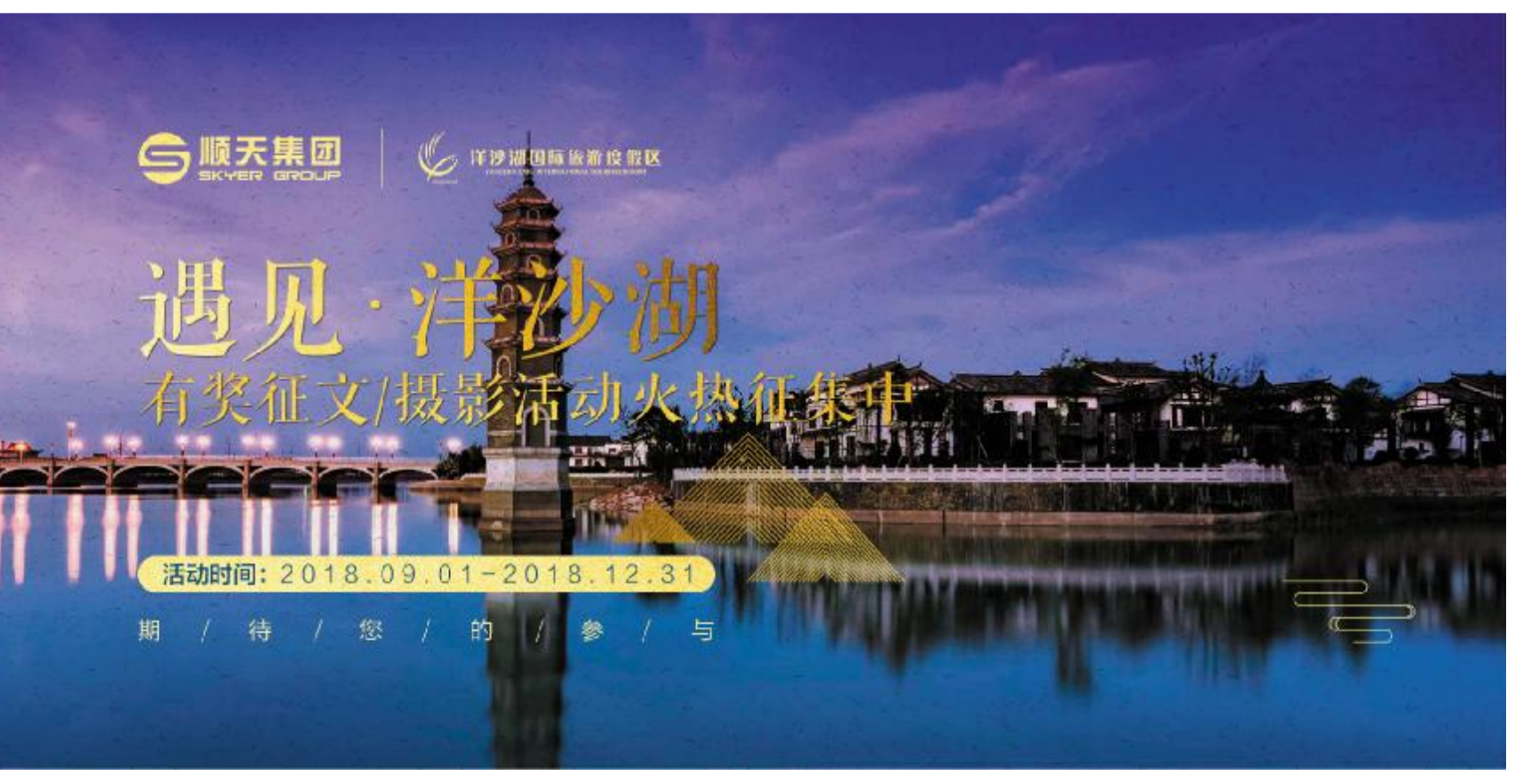
期 / 待 / 您 / 的 / 参 / 与

为践行“绿水青山就是金山银山”的发展理念，进一步激发社会各界对“洋沙湖”这一绿水青山生态佳作的热爱以及对美好生活的憧憬与畅想，更好地将洋沙湖独一无二的生态美、人文美和资源美展示在世人面前，湖南顺天集团组织开展“遇见·洋沙湖”有奖征文、摄影作品征集活动。