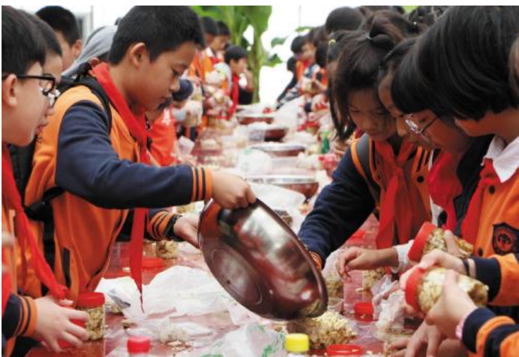
洋沙湖湿地公园农耕研学在这里等你的到来。

着自己种下的那颗能够茁壮成长，脸上的笑容像太阳一样耀眼；在玻璃温室大棚的孩子们像极了十万个为什么，他们童真的问题和满脸寻求答案的神情，让人不忍拒绝回答。