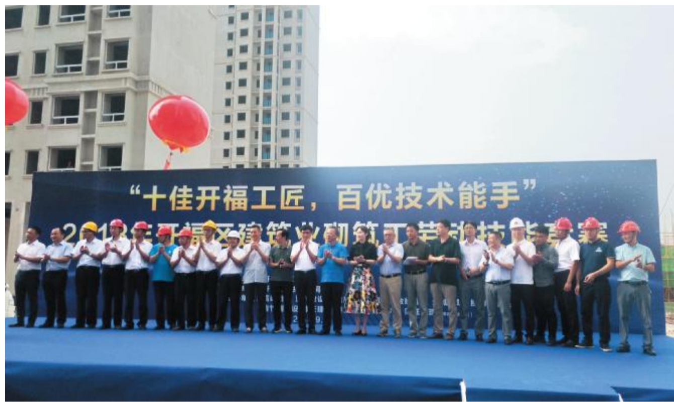
顺天建设参加“十佳开福工匠 百优技术能手”——2018年开福区建筑行业砌筑工劳动技能竞赛。

【本报讯】近日，“十佳开福工匠 百优技术能手”——2018年开福区建筑行业砌筑工劳动技能竞赛在开福区中岭农民安置房高岭项目部举行。