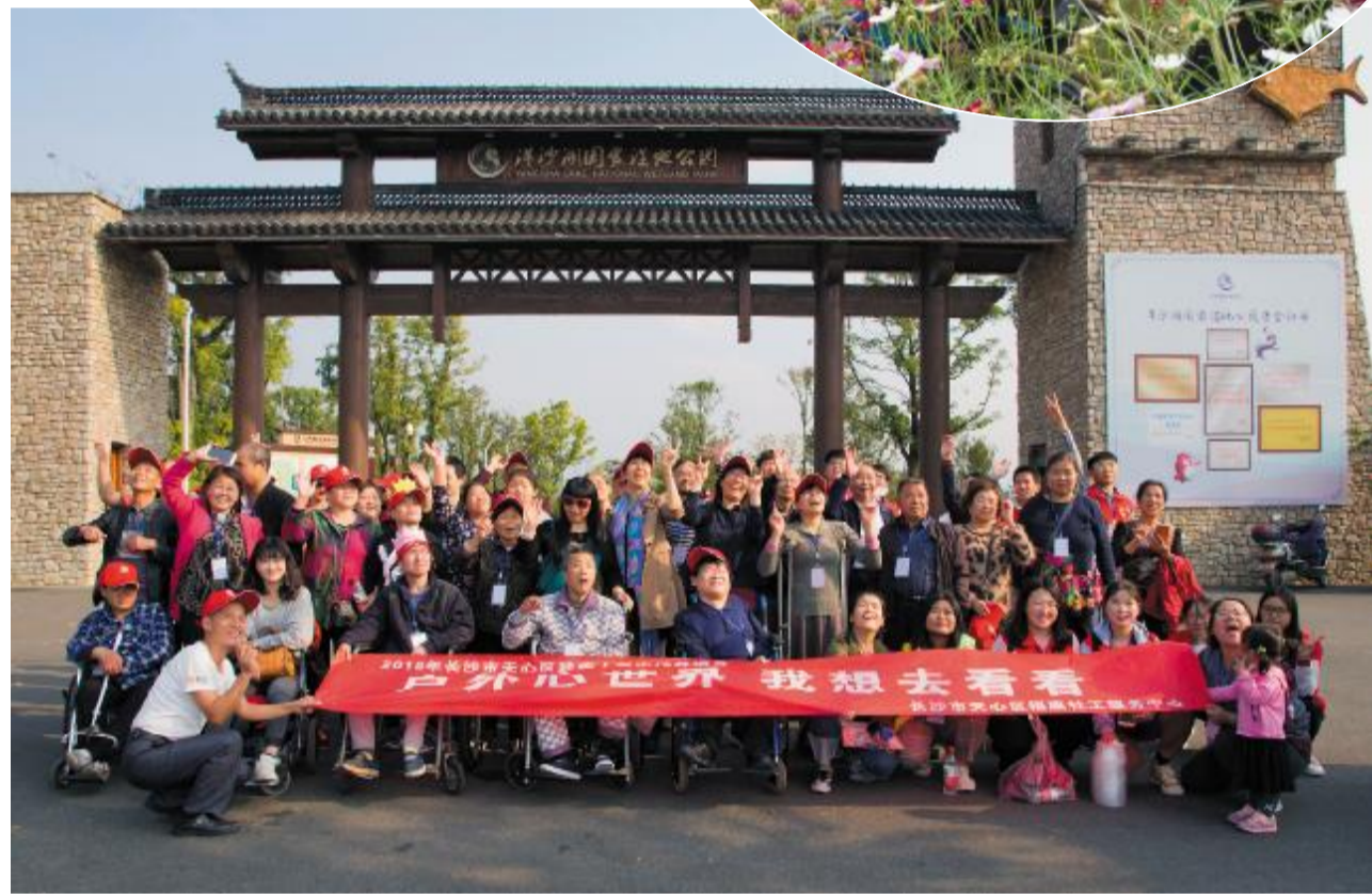
洋沙湖国际旅游度假区联合长沙市天心区福康社工服务中心开展助力残障人士出行梦活动，组织30多名残障人士游览湿地，观赏花海。